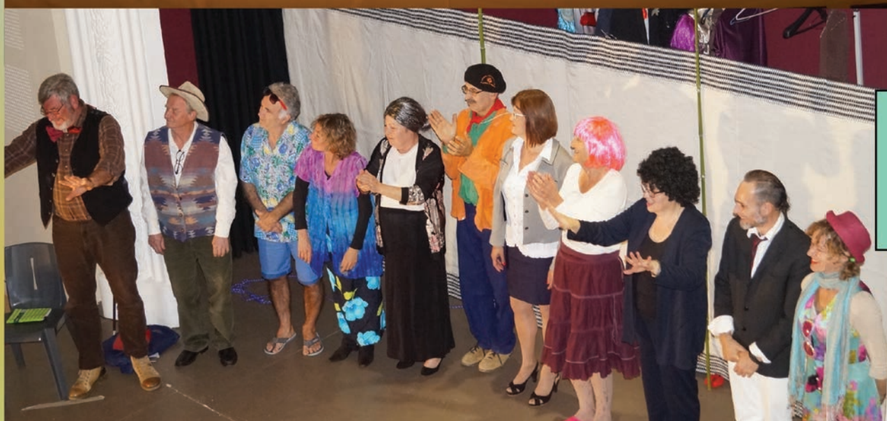
Troupe « Les Déjantés » association Amadart Vendredi 17 novembre