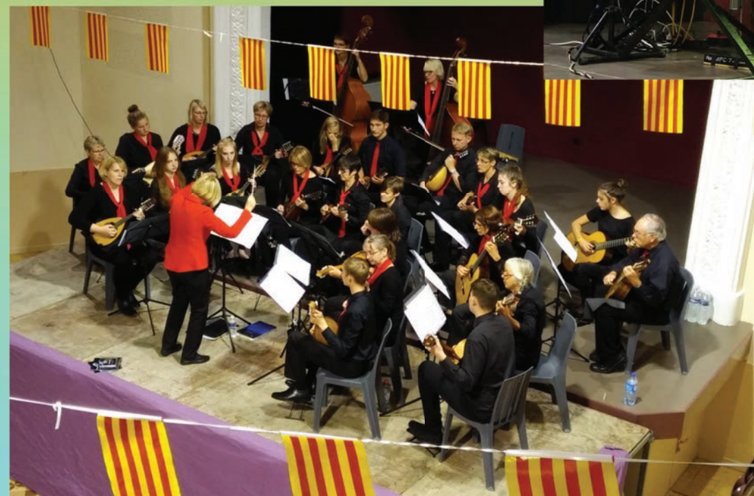
Concert des mandolines de Langendorf salle de l'avenir