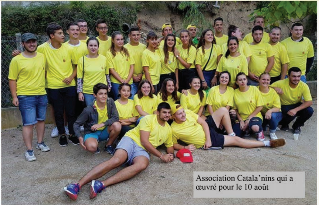
Association Catala'nins qui a œuvré pour le 10 août

Rendez vous en 2018 pour un programme riche et varié.