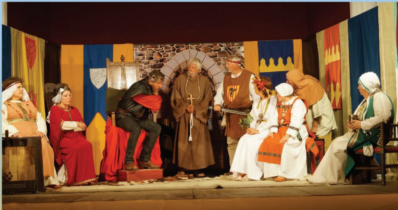
« Gondemare le maudit » Troupe de théâtre arlésien Samedi 4 novembre