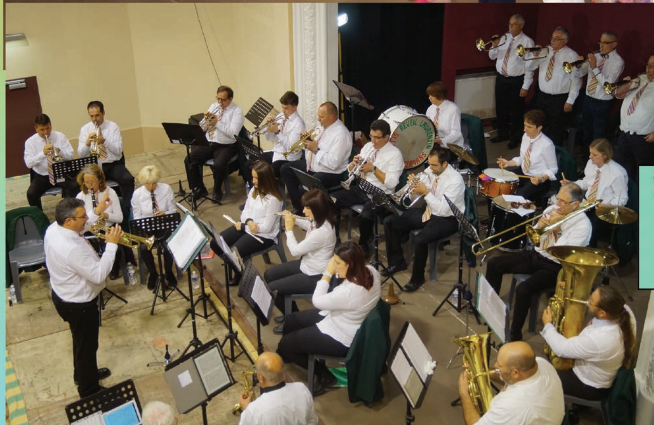
Concert de la Sainte Cécile du Réveil Laurentin Samedi 25 novembre