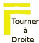
Tourner à Droite