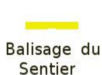
Balisage du Sentier