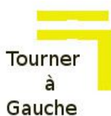
Tourner à Gauche